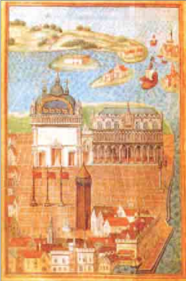
لوحة لمدينة فينيسيا في أواخر القرن الخامس عشر. كانت فينيسيا قوة عظمى في البحر المتوسط، عرفت باسم أعظم الجمهوريات رقيا . (انظر ص: 86).